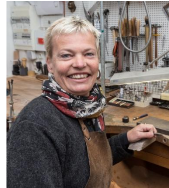
Lenny Vidal Photographies

Créatrice, réalisatrice mes univers de création sont multiples : la nature, une poésie, une sensation - Quel que soit le bijou, il reflète la personnalité de la personne qui le porte. Inspirée par mes racines nordiques, mon style est contemporain et intemporel. Je crée des pièces uniques, je réalise des bijoux originaux ou classiques, sur mesure, suivant votre désir. Je serai toujours heureuse de vous accueillir dans mon atelier et vous conseiller.