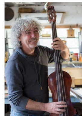
Lenny Vidal Photographies

Passionné de création et de restauration d'instruments de musique depuis vingt ans, je donne un second souffle aux pianos mécaniques, piano pneumatique, orgue de barbarie ou de salon ... Je travaille avec les musées et les collectionneurs grâce à ma grande connaissance des instruments anciens du XVIIème siècle jusqu'à aujourd'hui. Dernière née de mon atelier, ma Babybass, une contrebasse stylisée, légère et moderne.