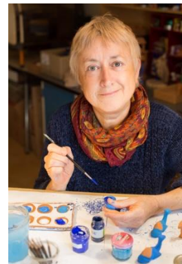
Lenny Vidal Photographies

Les santons et moi, c'est une histoire d'amour depuis vingt-cinq ans, un vrai coup de foudre quand j'ai vu les santons à la Foire de Marseille alors que j'étais étudiante aux Beaux-arts. Je perpétue la tradition tout en la faisant évoluer, notamment avec mes couleurs emblématiques : un camaïeu de bleu en hommage au célèbre bleu Klein. Je propose environ 80 modèles différents dans mes trois collections, bleue, traditionnelle et faïence et en crée de nouveaux chaque année.-