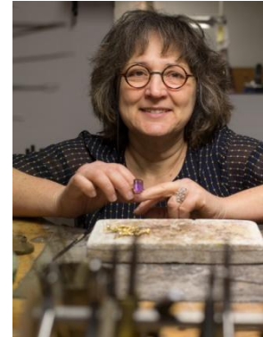
Lenny Vidal Photographies

Toujours passionnée depuis vingt ans par la création et la réparation de bijoux, je suis également joaillière. Un bijou, c'est très sentimental, cela marque les événements de la vie, cela se transmet de génération en génération, c'est pourquoi je m'attache à réaliser des projets qui vous ressemblent et sont uniques. J'aime les formes épurées qui mettent en valeur les pierres, je travaille à façon et réalise tout bijou en Or ou Argent, empierré ou non. Les fleurs m'inspirent tout particulièrement.