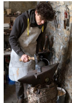
Lenny Vidal Photographies

J'ai toujours aimé l'objet-couteau, la chaleur m'a donné l'envie d'œuvrer avec la forge, le métal. La force et la souplesse de ce dernier, sa transformation me fascine. Attentif à notre environnement, je choisis des essences de bois et des matières provenant de France et je privilégie les sources locales proches de notre Mont-Ventoux et je pratique le recyclage de métaux de bonne qualité. Je conçoit aussi des tire-bouchons, des ustensiles de cuisine en bois et des sculptures totems.