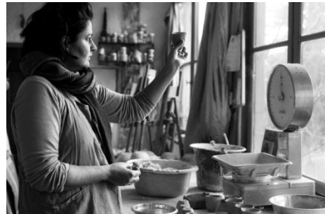
Lenny Vidal Photographies

Je suis céramiste et peintre dans le superbe village de Monieux, au pied du Ventoux, à l'entrée des Gorges de la Nesque. Attachée à la technique figurative, je peins à l'huile et aussi des aquarelles représentant l'intérieur de ma maison, une écriture autobiographique où la couleur tient une grande place. Je crée aussi des poteries utilitaires décorées par mes croquis de silhouettes de femmes, de portraits et de natures mortes. Thèmes classiques en peinture et très originaux et amusants sur des poteries utilitaires !